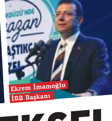
Ekrem İmamoğlu İBB Başkanı