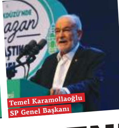
Temel Karamollaoğlu SP Genel Başkanı