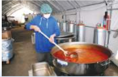
Bölgeye ulaşan sahra çadırlarından birinin içerisine kurulan endüstriyel mutfak ile günlük 15 bin kişiye 3 öğün yemek verilebiliyor.