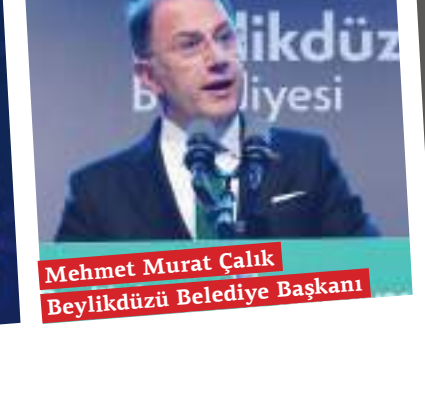
Mehmet Murat Çalık Beylikdüzü Belediye Başkanı