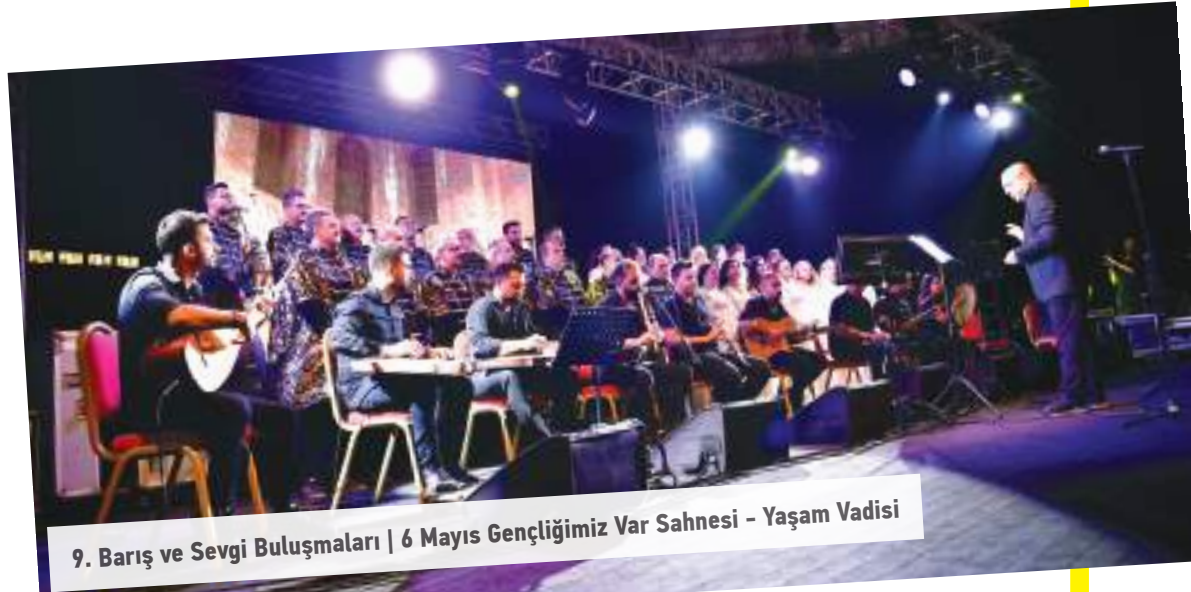
9. Barış ve Sevgi Buluşmaları | 6 Mayıs Gençliğimiz Var Sahnesi - Yaşam Vadisi