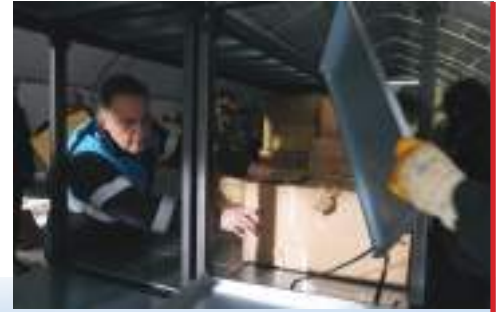
Lojistik depo olarak kullanılan sahra çadırlarında profesyonel bir raf sistemi uygulandı. Bu sistem ile alanlar daha fonksiyonel bir hale getirilerek bölgeye ulaşan yardımların ayrıştırılması kolaylaştırıldı.