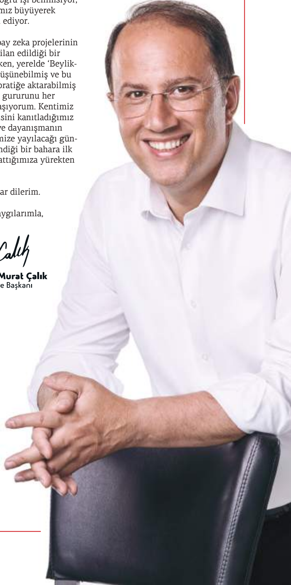
Mehmet Murat Çalık Belediye Başkanı