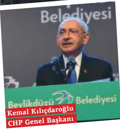
Kemal Kılıçdaroğlu CHP Genel Başkanı